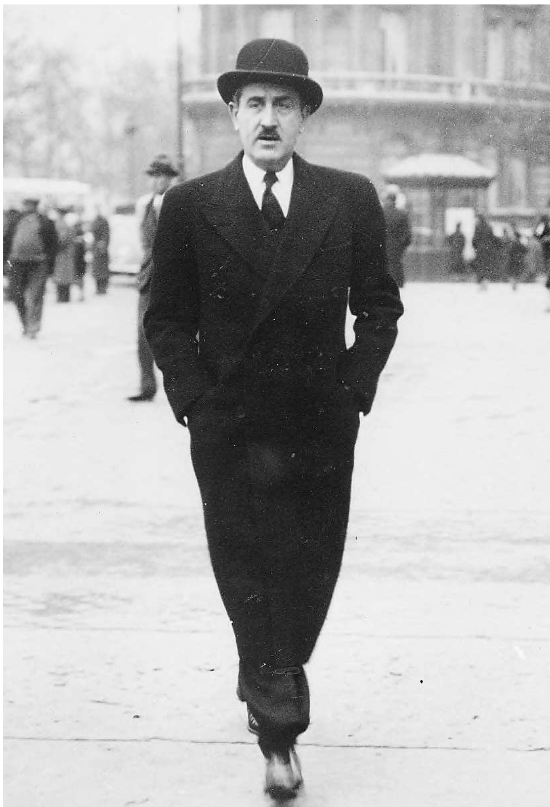
L'élection d'Adrien Marquet en 1925 sonne comme un coup de tonnerre à Bordeaux

Le « marquettisme ». « Pourtant, dès 1925, c'est un socialisme d'ouverture qui l'emporte, souligne Bernard Lachaise : dans la liste Marquet, les socialistes sont majoritaires mais font place à des radicaux, à des socialistes in-